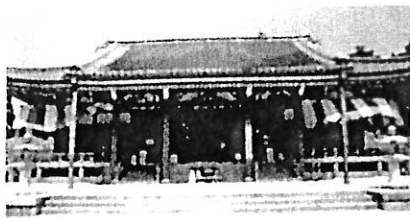
比叡山延暦寺 お車で40分

滋賀県立琵琶湖漕艇場 / 皇子山球場・陸上競技場 滋賀県立体育館・武道館 / 滋賀県立琵琶湖博物館 滋賀県立芸術劇場 びわ湖ホール 建部大社 / 三井寺 / 立木観音 / 岩間寺 / 義仲寺 イオンモール草津・マイカルシネマ パナソニック / 東レ / NEC ほか